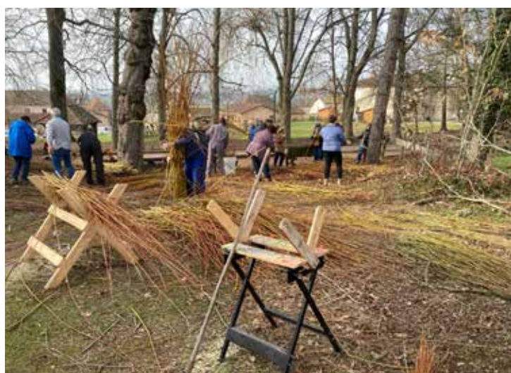
Récolte et tri de l'osier

Lors de ces manifestations nous exposons à la vente des réalisations et faisons des démonstrations, ceci permet de susciter la discussion afin de parler de notre activité donc de la faire connaître.