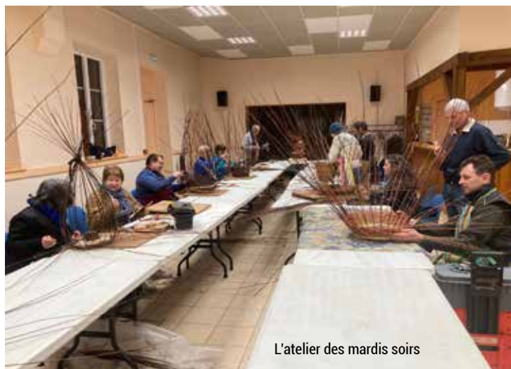
L'atelier des mardis soirs

Cette « campagne vannière » 2024-2025 fut la seizième « rentrée » de « l'atelier vannerie » qui se tient chaque mardi soir à la salle communale. Au fur et mesure des années le groupe s'est étoffé pour compter cette année une trentaine de participants (dont pour cet automne trois « débutants »).