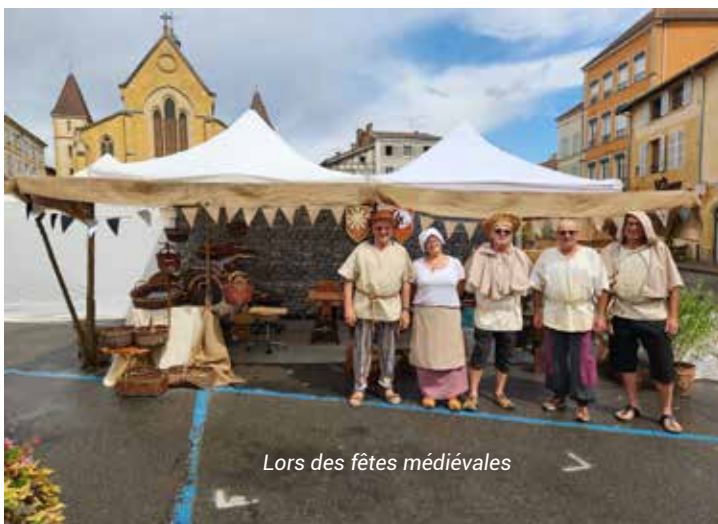
Lors des fêtes médiévales

Pour cette occasion nous avons « customisé » notre stand et costumé les participants façon moyen-âge. Nous avons même dormi sous notre barnum les deux nuits en question.