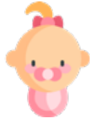
Emy CHARTIER 19 août