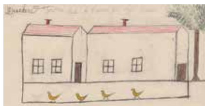
DUCARD 9 ans 1911