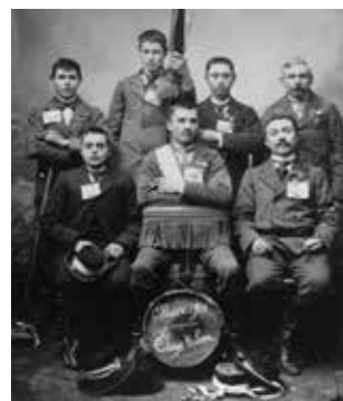
Les conscrits de Saint Hilaire en 1901