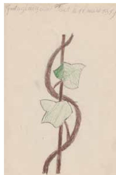
PEGUET 9 ans 1911