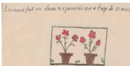
DEVEAUX 13 ans 1911