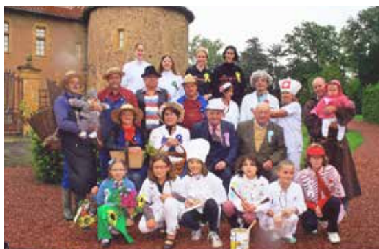
Souvenir de 2010

Afin de préparer cette belle journée, une première réunion d'organisation des classes aura lieu le 29 janvier 2021 à 20 heures à la salle André Précloux.