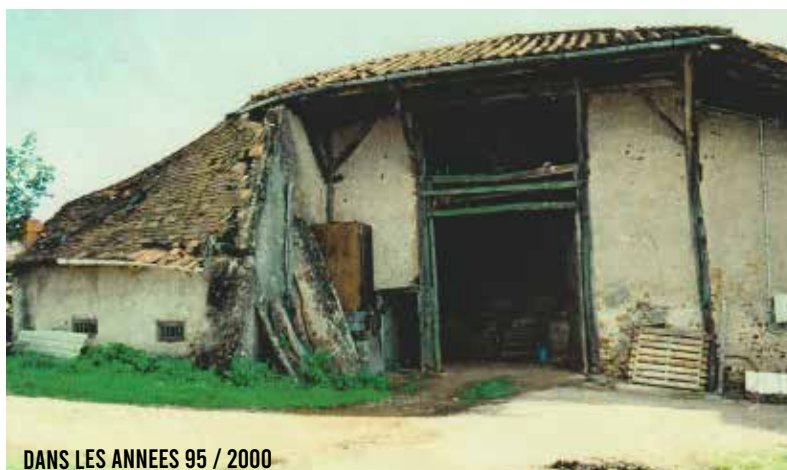
DANS LES ANNEES 95 / 2000

Le Grand Couvert est inauguré et est ouvert au public.