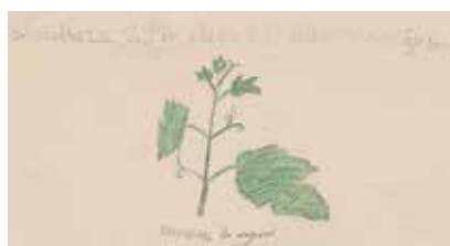
LOMBARD 8 ans 1910